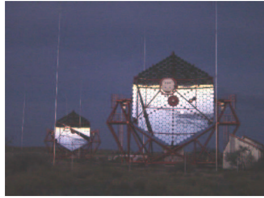
Figure 4: Vue de deux parmi les quatre télescopes de l'expérience HESS, basée en Namibie. Cette expérience permet de réaliser des cartographies de précision de sources gamma étendues comme le Centre Galactique, où l'annihilation des WIMPs pourrait se révéler.

de surface associés aux chaînes de désintégration de l'uranium et du thorium et du radon externe.