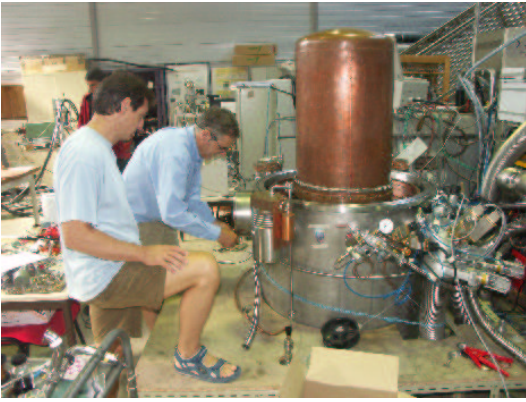
Figure 3: Le cryostat à dilution ^3\text{He}/^4\text{He} d'EDELWEISS-II, d'un volume utile de 100 litres, permet d'atteindre des températures inférieures à 10 mK en se dispensant presque totalement de fluides externes (azote et hélium liquides)